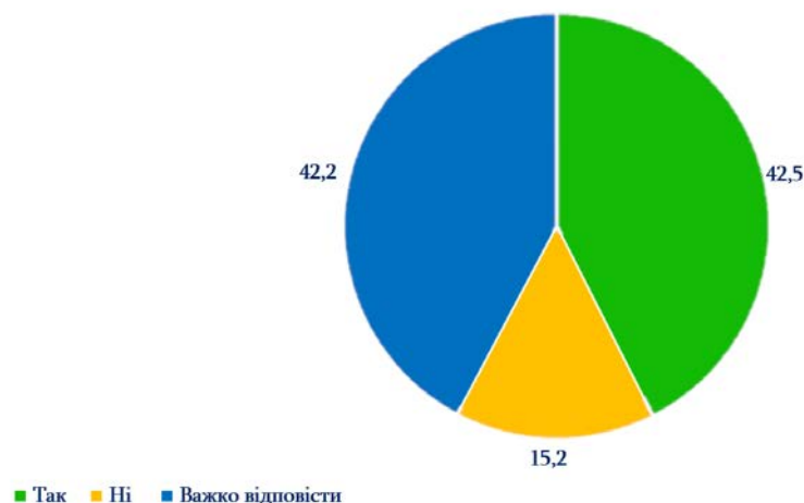
Рис. 1. Чи плануєте Ви після закінчення навчання залишитися та працювати у Вашому регіоні?, %

Запитавши студентів: «Чи плануєте Ви після закінчення навчання залишитися та працювати у Вашому регіоні?» лише 42,5% дали ствердну відповідь «так». Серед опитаних 15,2% студентів які точно не хочуть залишатися та працювати у своєму регіоні. Досить значний відсоток 42,2% хто не зміг визначитися з відповіддю, адже за вікном відбуваються воєнні дії які є чинником невизначеності багатьох молодих людей (див. рис. 1).