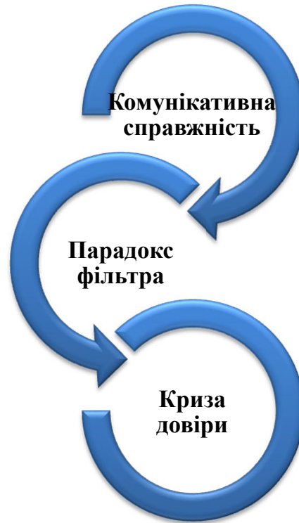
Рис. 2. Проблема комунікативної справжності

Невербальна комунікація у віртуальності переходить від біологічного до суто символічного рівня. Справжність у цифрову епоху – це не відсутність фільтрів, а етична інтенція бути почутим і зрозумілим. Звідси випливає пояснення вищеподаного, що технології не вбивають щирість, а навпаки – вимагають від людини нових когнітивних навичок для «зчитування» іншого.