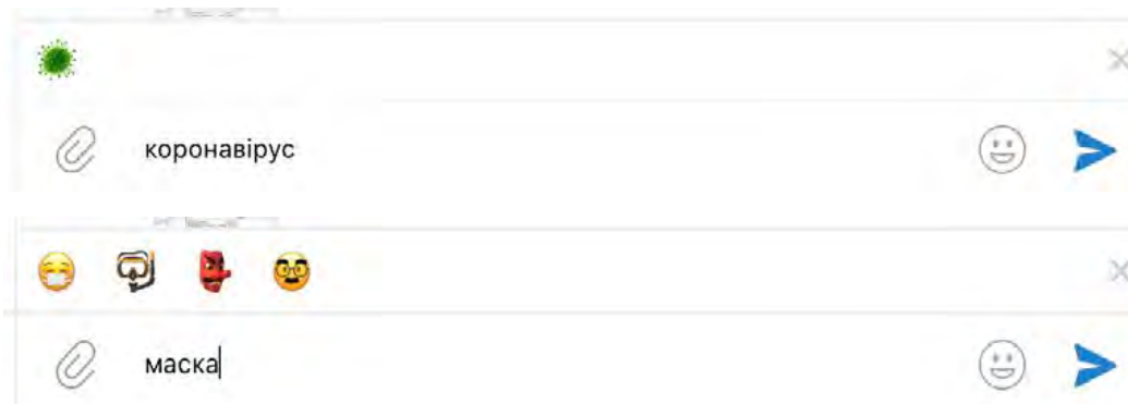
Рис. 1. Приклади зв'язку емодзі та їх найменувань

Цікавим залишається те, з якою інтенсивністю ті чи інші емодзі набирають популярність та стають актуальними і від чого це залежить. Певно, що це залежить від популярності слів, які ми використовуємо у повідомленнях. Так, наприклад, спілкуючись про коронавірус, автоматично нам пропонують емодзі, який це зображує, даючи змогу одразу з простого контексту зрозуміти про ще йде мова (див. рис. 1).