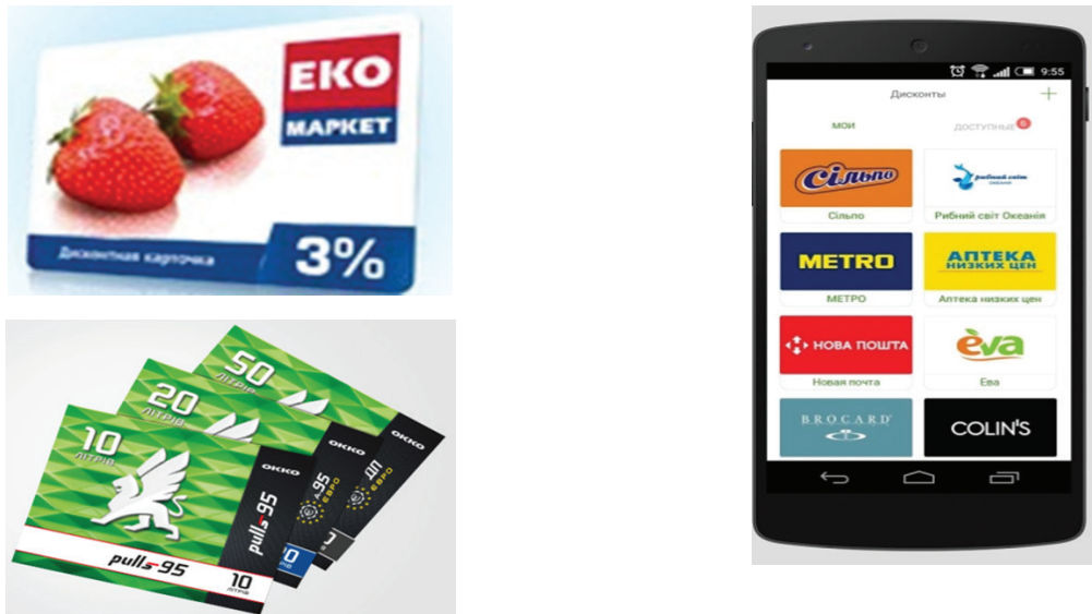
Рис. 2. Приклади близької до готівки допомоги (2000–2021 рр.)